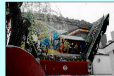
魚町のでか山 仙対橋にて