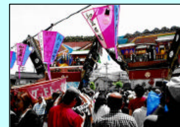
府中町のでか山 山王神社にて