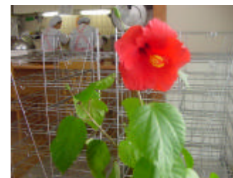
「デイケア・コスモス」にて

今年の冬は、近年でも珍しい大変な大雪となりましたが、皆さまにおかれましてはいかがでしたか。23号からは新しいスタイルの新聞となります。これについてメンバー・スタッフともども皆んなでいろいろと勉強しました。皆様方のお声をお聞かせ下さい。今後ともよろしくお願い申し上げます。